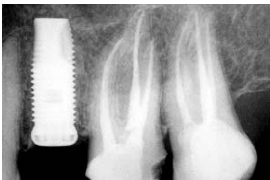
Abb. 5: Zahn 25 war frakturiert, wurde extrahiert und durch ein Implantat ersetzt. Das Röntgenkontrollbild zeigt den Zustand nach endodontischer und implantologischer Behandlung.

Farzaneh et al. (2004) veröffentlichten mit der Toronto-Studie (I und II) kontrollierte retrospektive Untersuchungen mit dem Ziel der Identifikation des Behandlungserfolges von Revisionen sowohl an Zähnen primär wurzelbehandelt mit und ohne apikaler Aufhellung. Die Autoren berichteten über eine Erfolgsrate von 97 % bei Zähnen ohne und 78 % bei Zähnen mit apikaler Aufhellung. Die gleiche Gruppe (Wang et al. 2004) untersuchte auch den Heilerfolg der chirurgischen Wurzelbehandlungsrevision innert obiger Studie und registrierte hierfür einen Heilerfolg von 74 %.