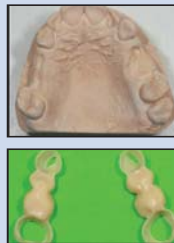
Meistermodell mit und ohne Snap-Ons, Ansichten der Snap-Ons