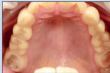
Okklusal-Ansicht der Snap-Ons in situ