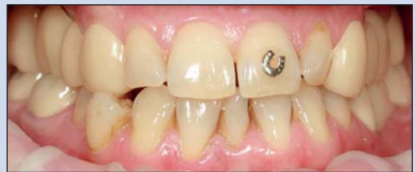
Lateral-Ansicht mit Snap-Ons in situ